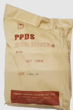
モデルギプス α 超硬石膏タイプ