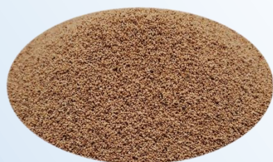
仕上げ用研磨メディア（クルミ粉） 1.5 kg / 袋