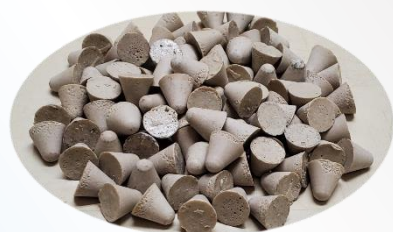
レジン用研磨メディア（粗）—グレー— 2.5 kg / 袋