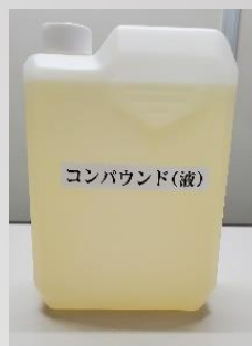
コンパウンド（液） 2 L / 瓶