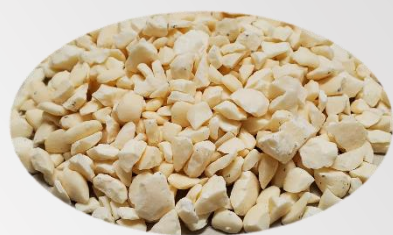
金属用研磨メディア（粗）—黄白色— 3 kg / 袋