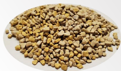
金属用研磨メディア（中）—茶色— 2 kg / 袋