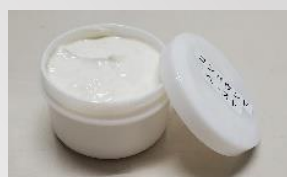
コンパウンド（ペースト） 100 g / ケース