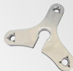
ブーメラン Neo（研磨ポット固定治具）