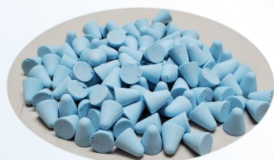
レジン用研磨メディア（中）—水色— 2 kg / 袋